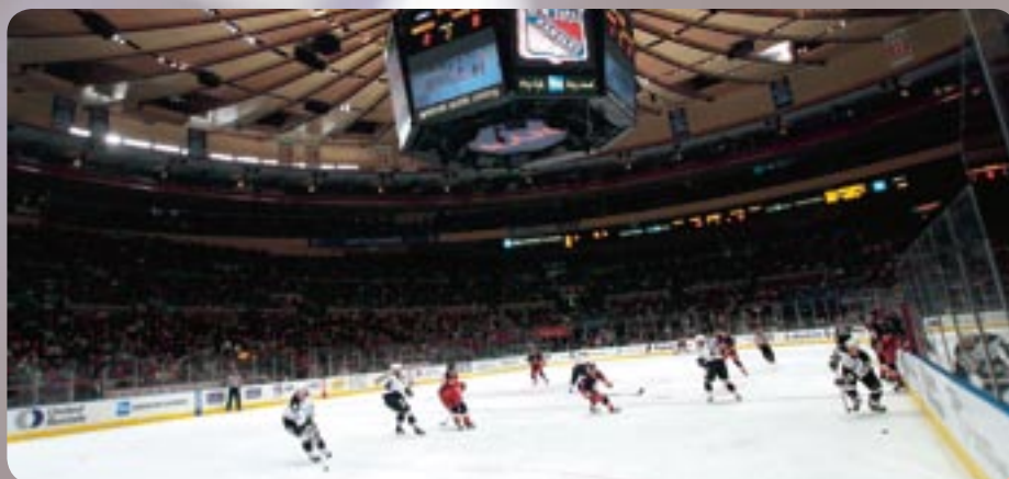
Madison Square Garden är en minst sagt majestätisk arena.

Säljer främst skräddarsydda resor till destinationerna New York, Detroit, Toronto, Boston och Tampa. Paketresa med matchbiljett, två hotellnätter och flyg kostar från 7.500 kr. Arrangerar vid några tillfällen per år gruppresor där flera NHL-matcher ingår, samt guide från researrangören följer med. www.latravel.se